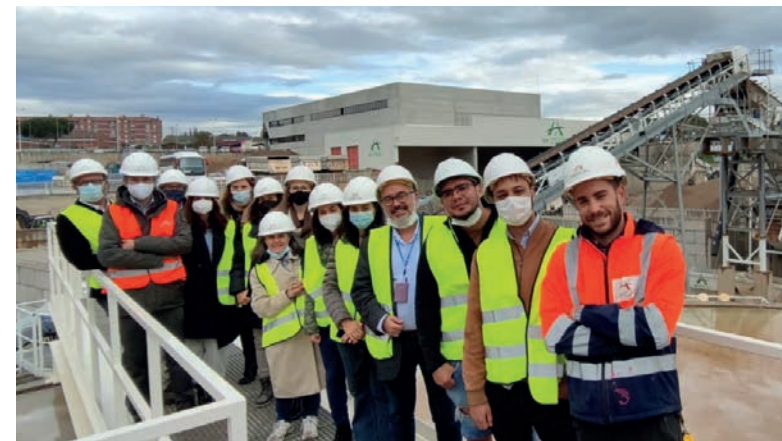
CEHOTSPOT (Convención internacional economía circular) – 16/11/21