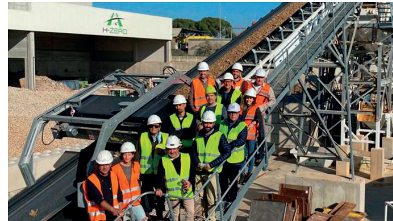
COLEGIO APAREJADORES (Estudiantes universitarios) – 18/10/21