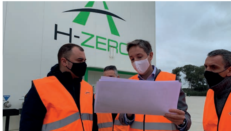
AJUNTAMENT TERRASA (Alcalde y técnicos) – 12/03/21