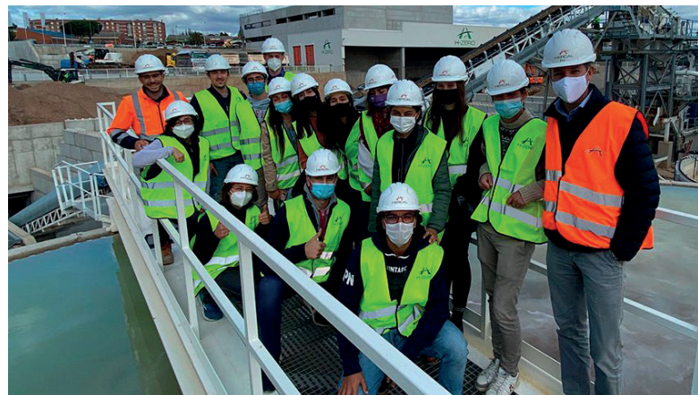
UPC (Estudiantes universitarios) – 03/11/21